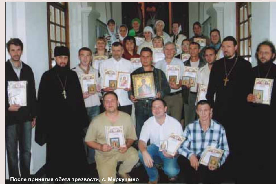
После принятия обета трезвости, с. Меркушино

С иконой Казанской Божией Матери связано освобождение Руси от иноземных завоевателей. «Заступница усердная, Мати Господа Вышнего», - так зывали к Царице Небесной наши благочестивые предки, так и ныне зывают к ней верующие в надежде на милость и избавление от бед и недугов.